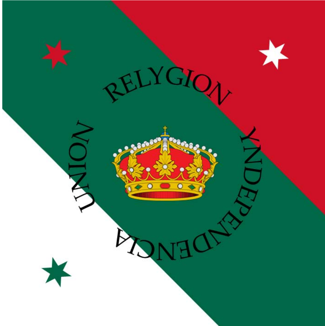
Bandera de Iturbide De las tres garantías 1821